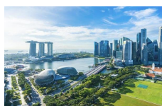
ASEAN(東南アジア)デスク