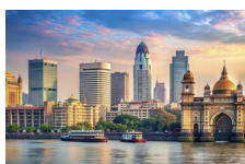
インドデスク/南アジア